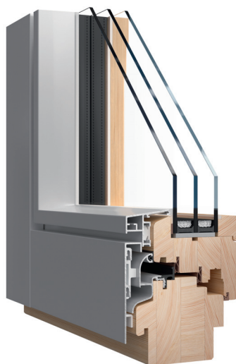
▲ Fot. 5 – Przekroje poprzeczne przez pionowe i poziome profile okna Thermo HS.

Także okna Elite 92 (fot. 4), dzięki zwiększonej grubości profili ram skrzydeł i ościeżnic