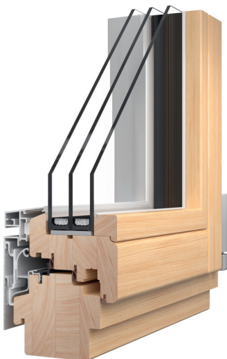
▲ Fot. 2 – Przekroje poprzeczne przez pionowe i poziome profile okna Flush (widok od strony wewnętrznej).