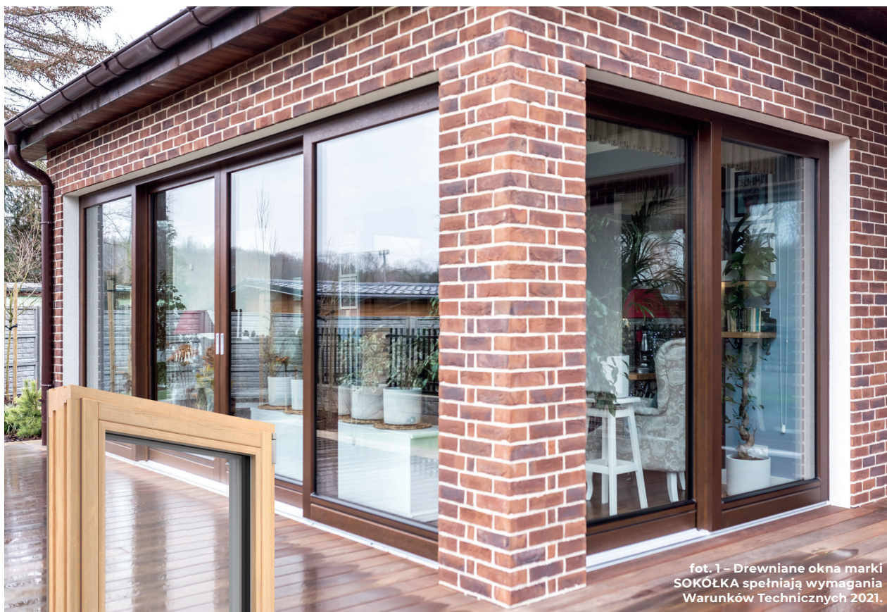
foto. 1 – Drewniane okna marki SOKÓŁKA spełniają wymagania Warunków Technicznych 2021.

Sokółka Okna i Drzwi obchodzi w tym roku 50-tą rocznicę powstania firmy. Już od 5 dekad Sokółka produkuje okna drewniane do domów w Polsce i za granicą. Kilka pokoleń patrzy na świat ze swojego domu przez okna Sokółki. Teraz firma pracuje nad tym, aby kolejne pokolenia cieszyły się drewnianymi i drewniano-aluminiowymi oknami premium przez kolejne dekady!